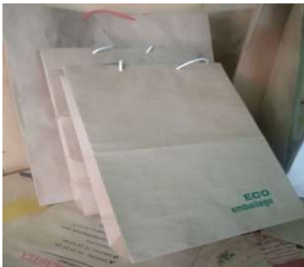
Sacs en papier recyclés produits par un jeune promoteur à Ouagadougou

On note également le retour des sacs tricotés que les femmes utilisaient dans le temps pour le marché. Ils sont faits soit en fils de cotonnade ou en nylon. Leur durée de vie est estimée à 10 ans. Des groupements féminins sont initiés à leur fabrication et des structures comme le CEAS Burkina ont privilégié leur vulgarisation dans leurs zones d'action.