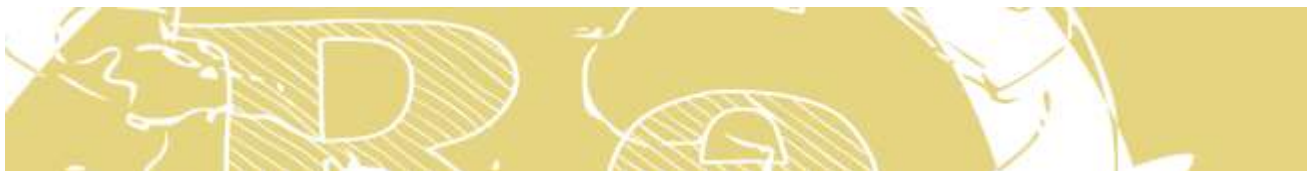
Table de matières