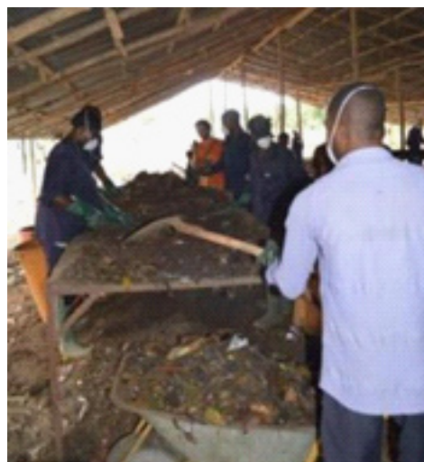
Figure 1 : Tri (Lomé)

➤ Tri mécanisé avec cribleur, rarement observée dans les localités des partenaires Re-Sources