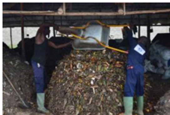
Figure 2 : Mise en andain (Lomé)

La fraction fermentescible des déchets triés est mise en andain pour permettre la fermentation et la maturation de la matière. Des andains circulaires ou en longueur (de plus grande taille) peuvent être constitués. La réalisation d'andains en longueur permet une économie de l'espace disponible. Cependant, pour des unités de faibles capacités, la mise en andains circulaires peut être suffisante, au regard des tonnages traités. Un andain doit regrouper des déchets triés durant un maximum de 2 ou 3 jours. Lors de la mise en andain, l'humidité doit être contrôlée et, si nécessaire, un apport d'eau doit être réalisé par arrosage.