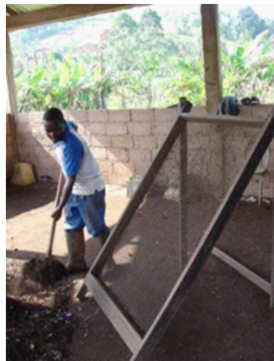
Figure 6 : criblage manuel avec plan incliné (Dschang)