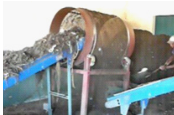
Figure 5 : criblage par crible rotatif à Mahajanga