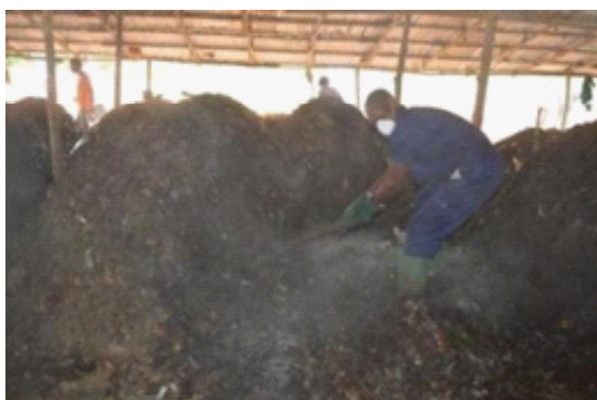
Figure 4 : Retournement (Lomé)

L'aération peut se faire par retournement ou par insufflation d'air. L'insufflation peut se faire de façon passive à l'aide d'un tuyau perforé qui traverse l'andain ou forcée par un système de ventilation mécanisé. Les systèmes d'insufflation ne sont pas utilisés par les unités des partenaires de Re-Sources.