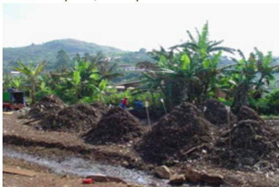
Figure 3 : Andains circulaires en fermentation (Dschang)

Par conséquent, cette phase nécessite le contrôle de l'humidité, de la température et de l'apport d'air.