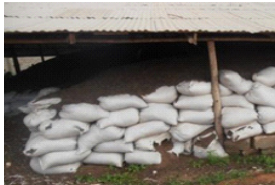
Figure 8 : stockage du compost (Lomé)

Le stockage et la vente du compost peuvent se faire en vrac ou en sac. La vente en vrac permet de diminuer les coûts mais nécessite d'adapter la commercialisation en conséquence.